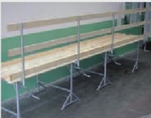
Kozioł budowlany Altrad-Mostostal z pomostami drewnianymi (z oporęczowaniem)

wych o wysokości 1,14 m. Należy pamiętać, że stosowanie oporęczowania konieczne jest przy wysokości kozła powyżej 1 m.