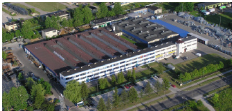
Fot. 13. Siedziba firmy Altrad-Mostostal w Siedlcach

Surowce, z których wytwarzane są powyższe produkty (stal o podwyższonej wytrzymałości, zabezpieczona przed korozją cynkowaniem ogniowym, aluminium najwyższej jakości oraz wodoodporna sklejka) zawsze pochodzą od renomowanych producentów, a ich jakość potwierdzona jest atestami. Ponadto firma posiada dopuszczenia spawalnicze SLV na rynek niemiecki oraz certyfikat ISO 9001:2009, wery-